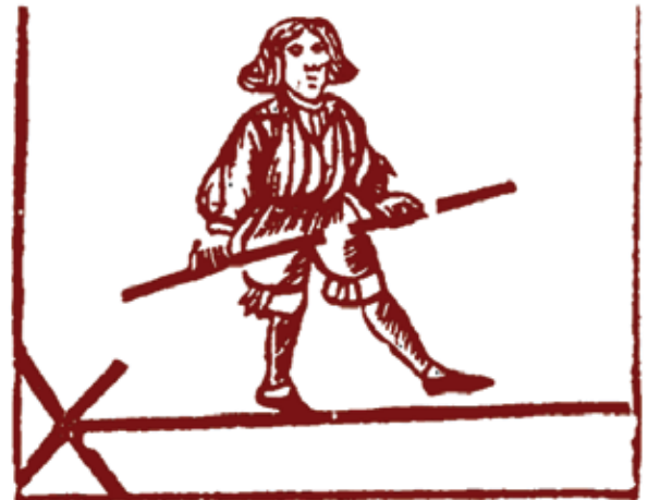
DANST OP DE COORDE

De toevloed aan beelden (oude en nieuwe) die ons vanuit de media overspoelen, is enorm. Het is soms moeilijk door de bomen het bos niet meer zien. De cursus beeldhouwen op de academie biedt hiervoor een grid aan om vanuit die fantastische overvloed een eigen en persoonlijk standpunt in te nemen. De benadering is zowel technisch, vormelijk als thematisch.