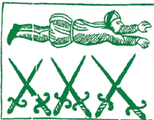
SPRONGH OVER OEGENS

stapelen of assembleren... De evolutie van de technieken is zonder twijfel van grote invloed geweest op de evolutie van de vormgeving van een beeld. Omgekeerd zal een technisch probleem om een bepaalde vorm weer te geven zeker aanleiding geven tot nieuwe technische ontwikkelingen. Marmerbewerking is hiervan een mooi voorbeeld: van de voornamelijk geschuurde beeldjes van de Cycladeneilanden (7000 BC) tot de virtuoos bewerkte beelden van Bernini (17 de eeuw). Vorige eeuw nog zorgde het gebruik van staal, dat door de industriële revolutie ruim beschikbaar en beter manipuleerbaar werd, voor een grondige vernieuwing van de beeldtaal.