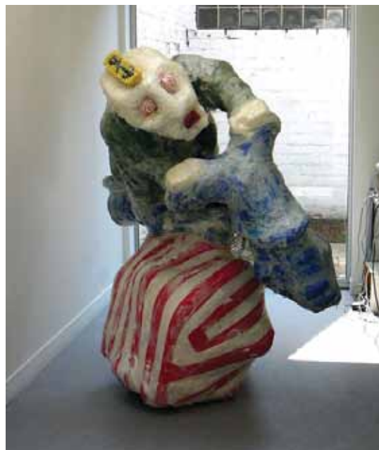
"The human race" Wouter Feyaerts