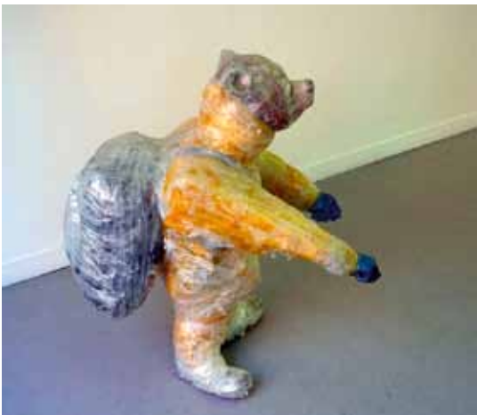
Wouter Feyaerts 'Hocus Focus'

Beeldend kunstenaar en docent M-atelier Wouter Feyaerts (1980 Brasschaat) is een plastisch denker. Zijn beeldhouwwerken getuigen van een vernieuwend materiaal-, vorm- en ruimtelijk onderzoek, gecombineerd met verwijzingen naar zowel de populaire cultuur als de kunstgeschiedenis. Feyaerts werkt procesmatig en laat een deel van zijn werkwijze over aan het toeval. Dit resulteert in een uitgesproken coherent sculpturaal oeuvre.