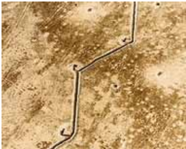
Sophie Ristelhueber; Fait, 1992

De lezing Slow Photography, Posities van hedendaagse beeldmakers op 20 oktober was een succes!