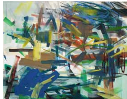
Virginie Bailly, "Vide-Plein III" (Pleasant Grove), 2011