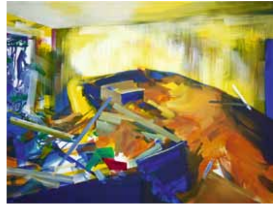
Virginie Bailly, "Le Corps disloqué 5", 2012

Fragment uit De picturaliteit van ongreepbare fenomenen, Filip Luyckx, 2007