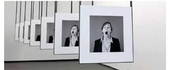
© Kristien Daem, 'Der Wunsch, Teil eines Bildes zu sein', ACT2, 2014

Fotografe Kristien Daem documenteert sinds het begin van de jaren '80 het werk van talrijke kunstenaars en architecten. De visie en typerende stijl die ze daarbij ontwikkelde vertaalde zich in een conceptuele fotografische benadering van tijd en ruimte en resulteerde in verschillende hoog kwalitatieve publicaties.