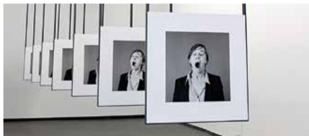
© Kristien Daem, 'Der Wunsch, Teil eines Bildes zu sein', ACT2, 2014

Donderdag 26 november om 19.00u, foyer SLAC Fotografe Kristien Daem documenteert sinds het begin van de jaren '80 het werk van talrijke kunstenaars en architecten. De visie en typerende stijl die ze daarbij ontwikkelde vertaalde zich in een conceptuele fotografische benadering van tijd en ruimte en resulteerde in verschillende hoog kwalitatieve publicaties.