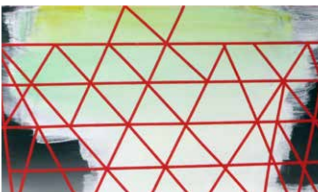
© Tina Gillen, 'Structure', 2011, courtesy the artist

Donderdag 10 december om 19.00u in M-Museum Tina Gillen baseert zich voor haar schilderijen doorgaans op bestaande beelden zoals postkaarten, reproducties, film stills en foto's. Ze werkt op het raakvlak tussen figuratie en abstractie, tussen het platte vlak en de ruimte. Door verschillende manipulaties van het beeld wordt de afstand tot de realiteit vergroot. Een beeldfragment wordt geïsoleerd weergegeven tegen een egale achtergrond of het wordt dermate geabstraheerd dat het haast onherkenbaar wordt. Deze ingrepen verhinderen een naïeve lezing van het schilderij als een getrouwe weergave van de zichtbare werkelijkheid.