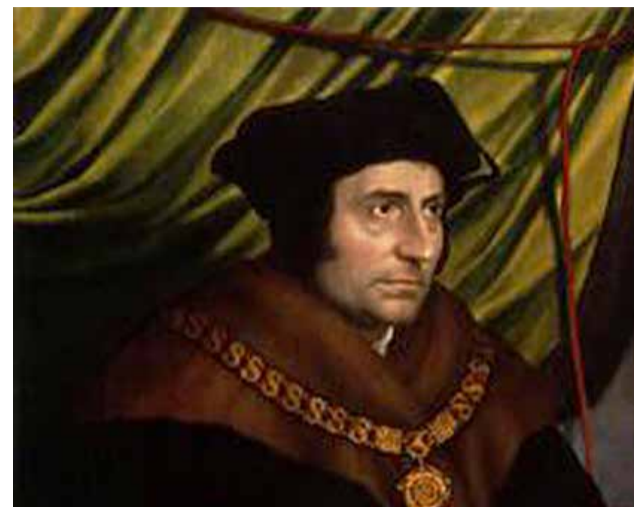
Naar Hans Holbein de Jongere, Portret van Sir Thomas More, 1527. National Portrait Gallery, Londen.

In 2016 is het 500 jaar geleden dat de Engelse humanist en politicus Thomas More in Leuven zijn boek Utopia publiceerde. De verjaardag van deze mijlpaal in de Europese intellectuele en culturele geschiedenis is de aanleiding voor het stadsbrede project "Op zoek naar Utopia" en voor een omvangrijke tentoonstelling in M-Museum. Vzw KU[N]ST Leuven coördineert het project.