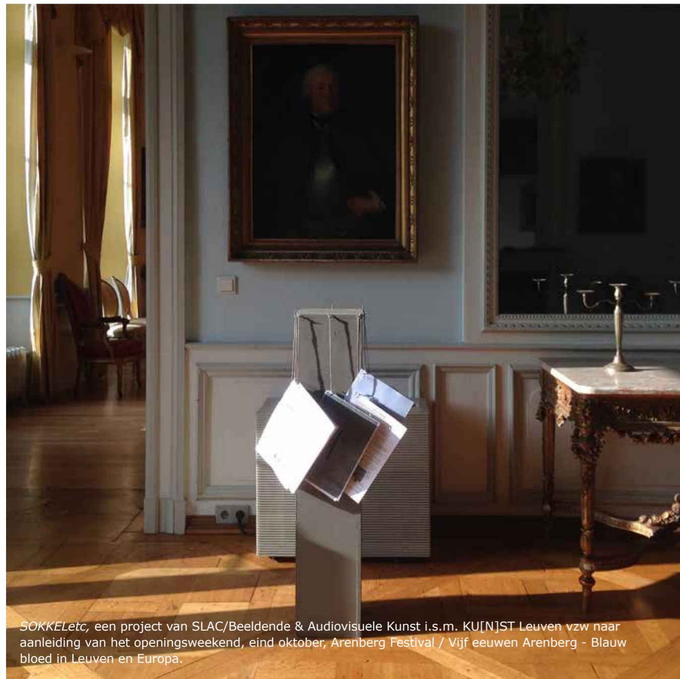
SOKKE etc, een project van SLAC/Beeldende & Audiovisuele Kunst i.s.m. KU[N]ST Leuven vzw naar aanleiding van het openingsweekend, eind oktober, Arenberg Festival / Vijf eeuwen Arenberg - Blauw bloed in Leuven en Europa.