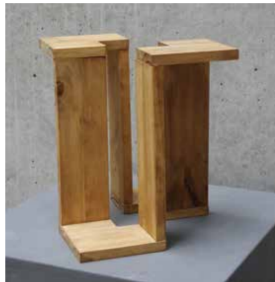
Analia Marina Stilering Tweekoppige Arend