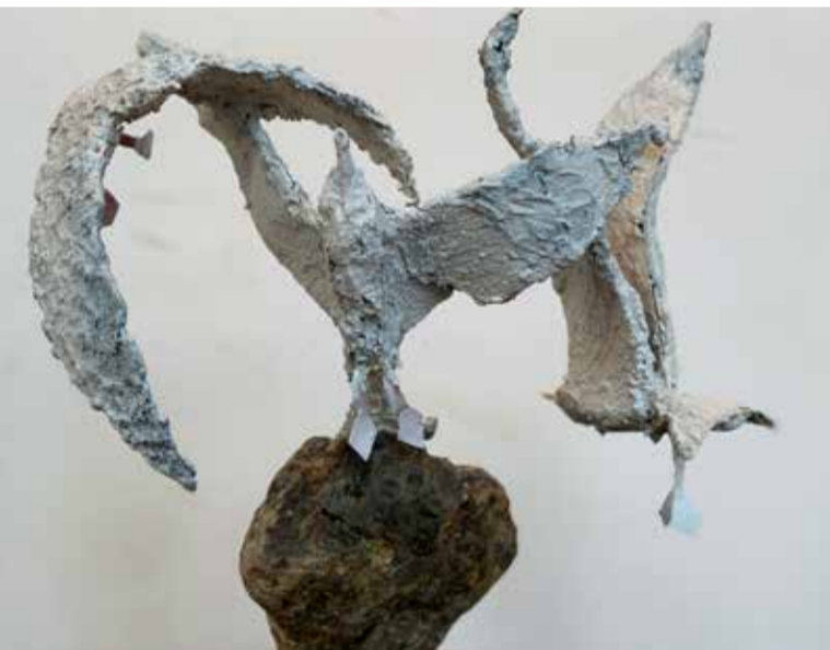
Peter Van Woensel Seagulls on a rock