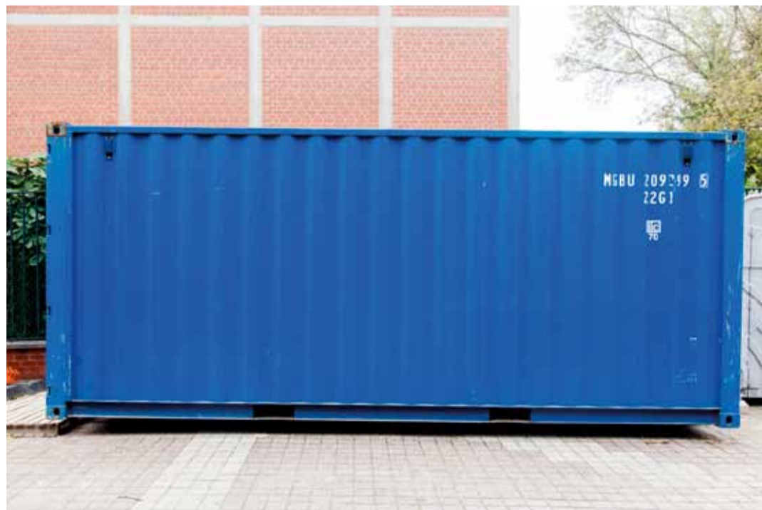
'Signalblau' Lieven Van Landschoot