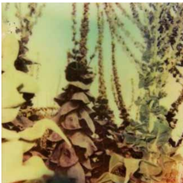
"The garden" Griet Vanhumbeek

Woensdag t.e.m. zaterdag van 14.00 tot 18.00u Kapel Romaanse Poort, Brusselsestraat 63, 3000 Leuven