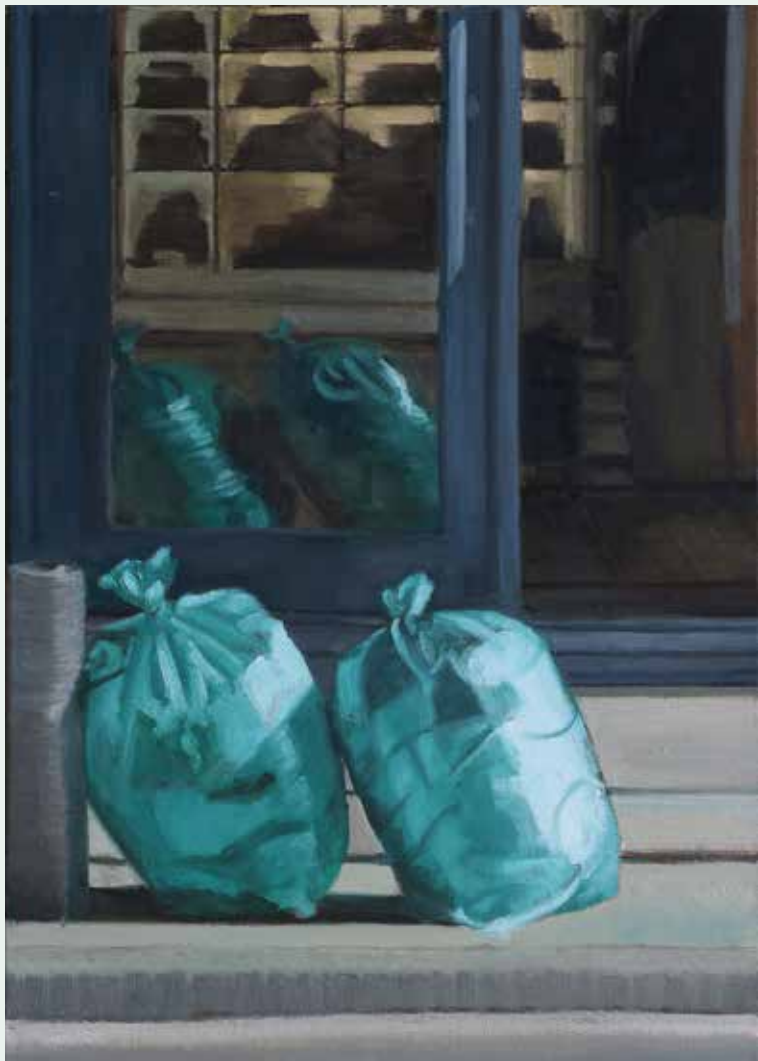
Tijd II olie op canvas 70x50