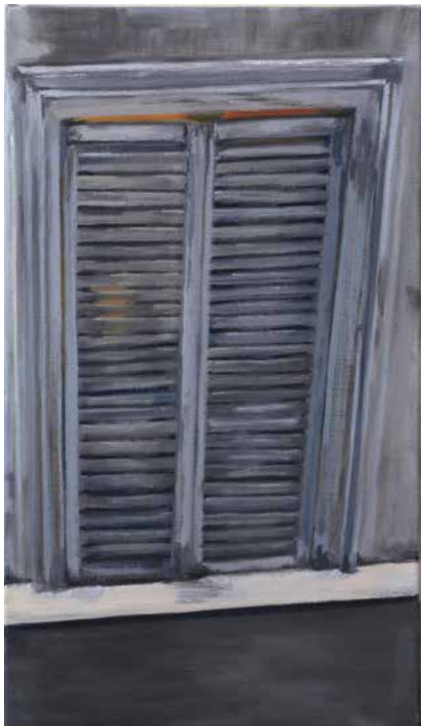
Tijd I olie op canvas 70x50