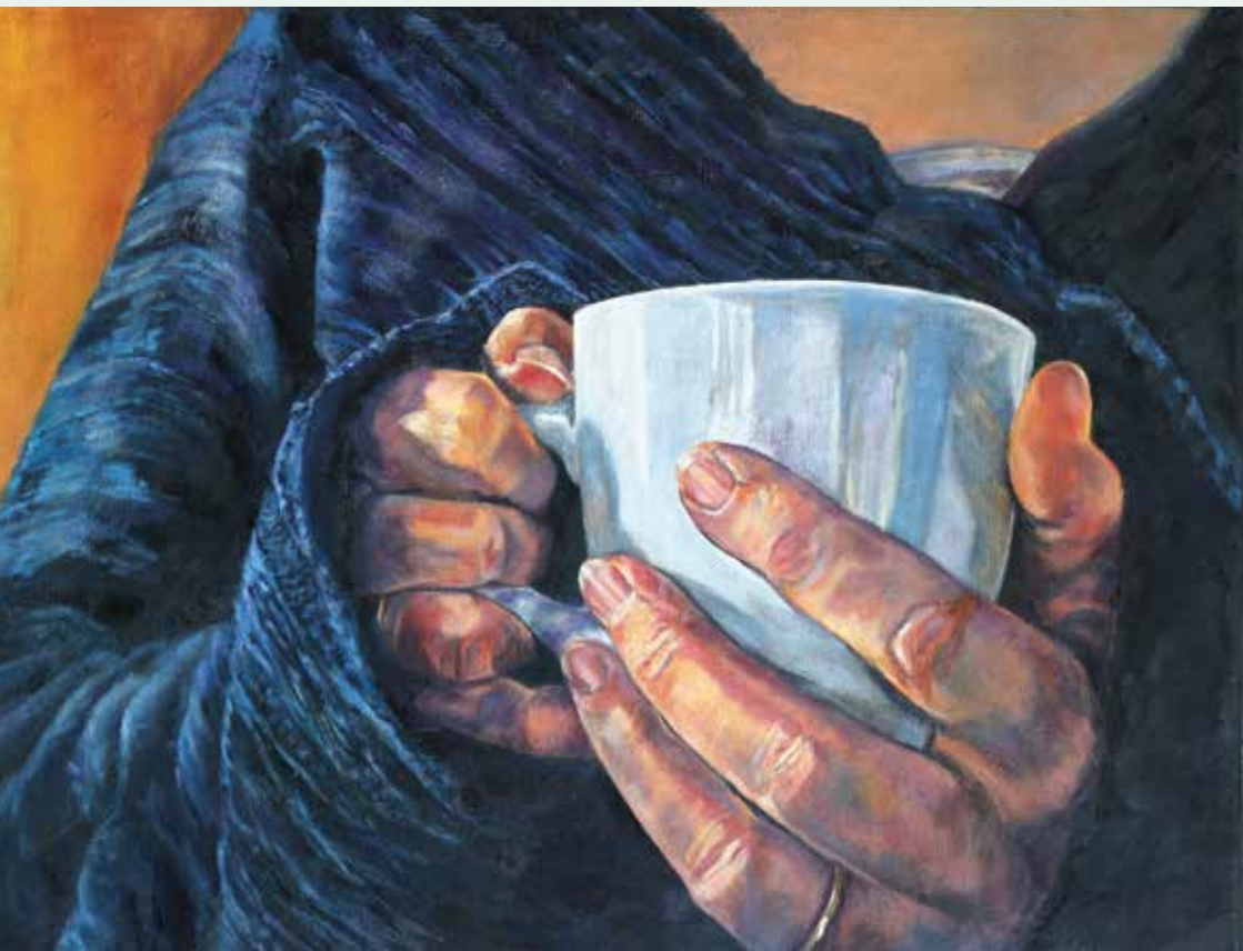
Pauze olie op canvas 70x50