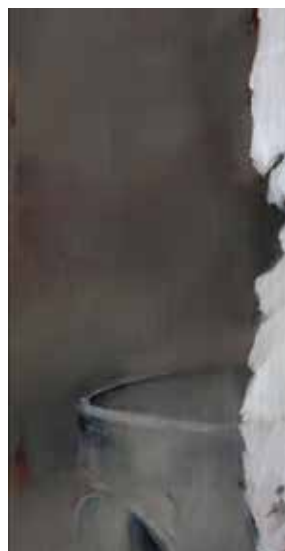
I'm waiting 1 olie op canvas 60x90