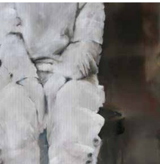
I'm waiting 2 olie op canvas 60x90