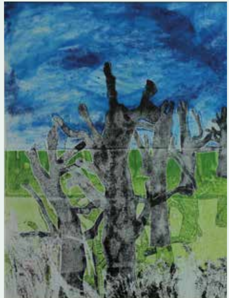
WOI 1918 monoprint drieluik 50x70