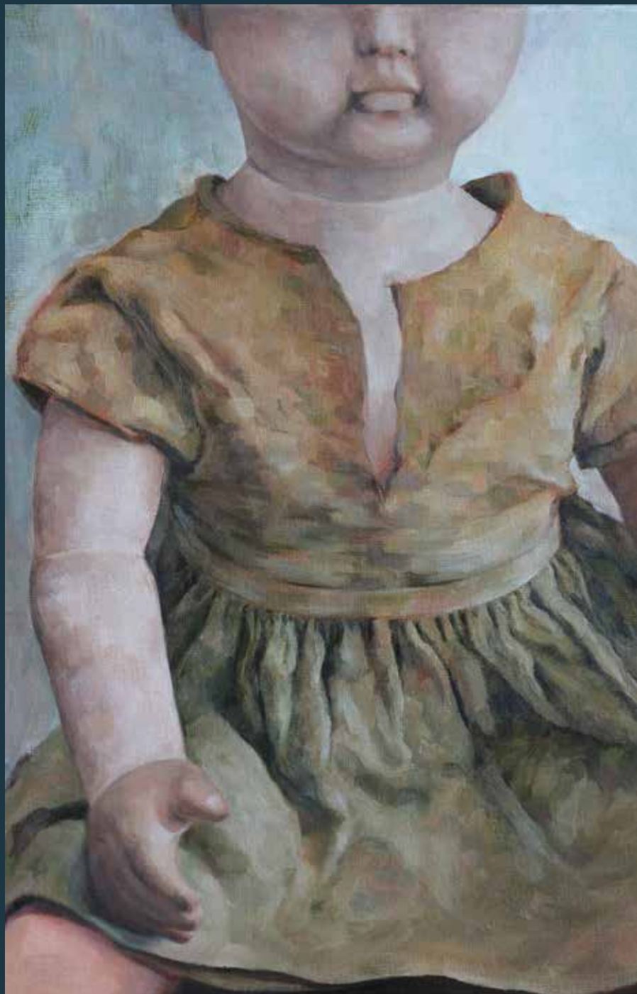
zonder titel olie op canvas 80x60