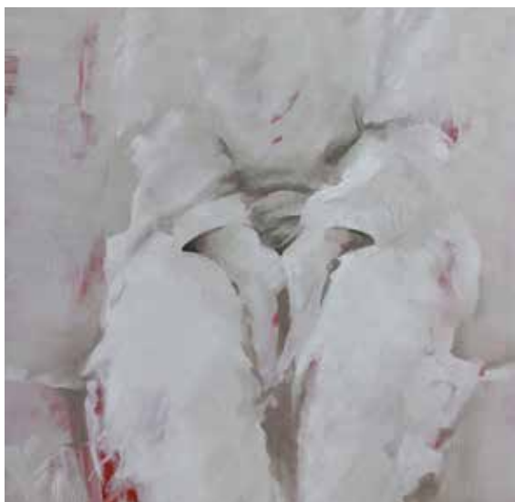
I'm waiting 3 olie op canvas 60x60